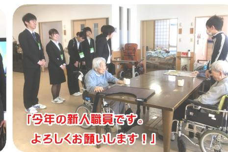
「今年の新人職員です。 よろしくお願ひします!!」