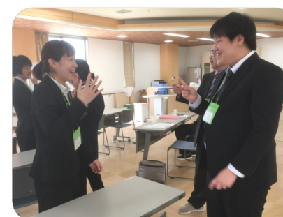
~メンタルヘルス研修~