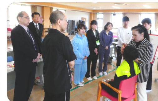
~歯科衛生士による口腔ケア講座~