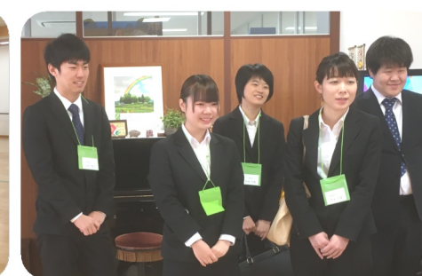
新人職員が施設をまわり、入所者の皆様にご挨拶しました。