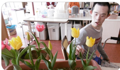
2019年4月17日 満開になりました！