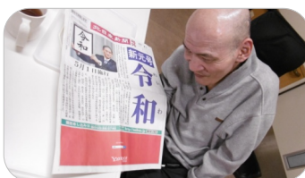
号外が発行されましたね