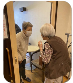
パーティション越しの面会の様子

日頃より、当施設の運営にご理解を賜り厚く御礼申し上げます。 ご家族様、関係者の皆様には、新型コロナウイルス感染予防のための面会制限にご理解とご協力をいただき深く感謝申し上げます。 ご利用者の皆様の健康を守り、感染予防対策に万全を期すため面会制限を実施しておりますが、当面の間継続させていただきます。 ご不便をお掛けしますが、よろしくお願い申し上げます。 なお、ご希望の方には、大型のパーティションを利用した面会や、スマートフォン・パソコンを使ったオンライン面会が可能ですので、ぜひご活用ください。