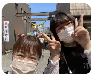
リモート中継班のふたり