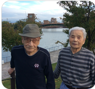
富岩運河環水公園へ。広い公園では、お散歩中の方がいらっしゃいました。

暖かく天気の良い日に、富山市内にドライブに出かけました。ご利用者の皆様は、心地よい風に吹かれながら「外はやっぱり気持ちいいね」「気分転換になった、ありがとう」ととても喜んでいらっしゃいました。