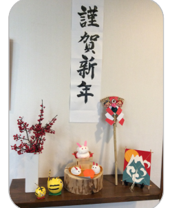
弐番館の玄関に飾らせていただきました。