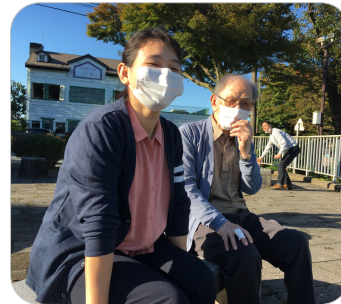
呉羽山展望台へ。天気が良かったので、遠くの景色まで見えました。