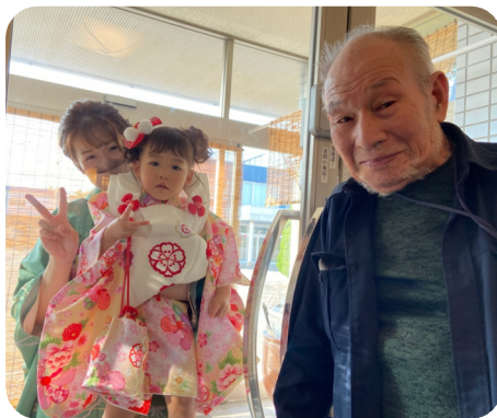
七五三を迎えたひ孫さんが晴れ姿を見せに来てくれました。