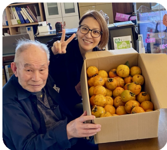
ご利用者のご家族様から柿の差入れ。秋の味覚、おいしくいただきました。

ご利用者の皆様に、柿やゆず湯、クリスマスなど、季節の風物詩を楽しんでいただきました。