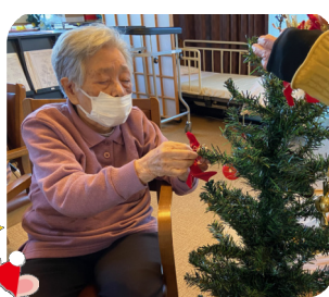
クリスマスツリーに飾りつけをしました。