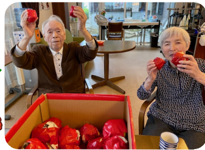
ミニ運動会で玉入れをしました。