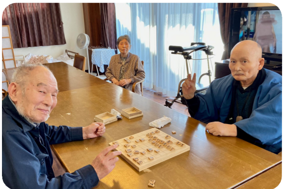
将棋がお好きなお二人。いつも対戦していらっやいます。