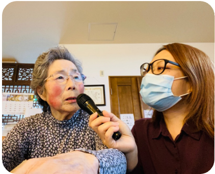
カラオケで「もみじ」「夕焼け小焼け」などを歌われました。童謡や民謡がお好きだそうです。