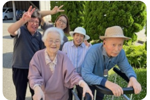
ありそ館の周辺をお散歩