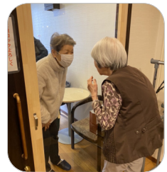
パーティション越しの面会の様子

なお、ご希望の方には、大型のパーティションを利用した面会や、スマートフォン・パソコンを使ったオンライン面会が可能ですので、ぜひご利用ください。