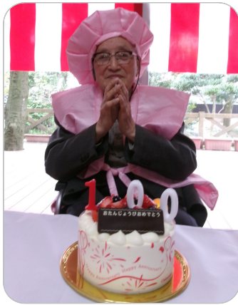
浦山様 おめでとうございます!

花みずきから日本の平均寿命を伸ばしていく時代が到来ですね！ 来年は101歳のお誕生日をお祝いさせていただきますね。