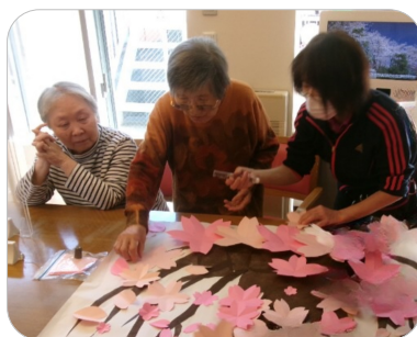
職員と一緒に、一枚一枚丁寧に桜の花びらを貼りました