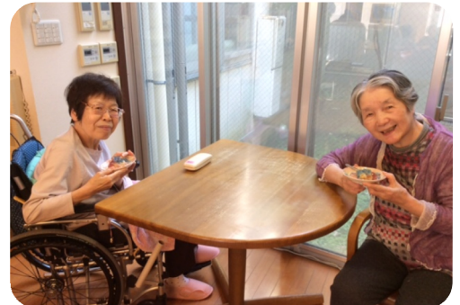
ゼラチンを溶かし、青やピンクのゼリーを作りました。