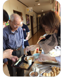
たこ焼きや焼きそばなど、おいしいごちそうがたくさん!