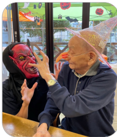
照れながらも「どう?」「似合うかな?」と仮装で楽しそうな皆様(*^-~*)