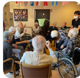
パン食い競争や玉入れなどで大いに盛り上がりました!