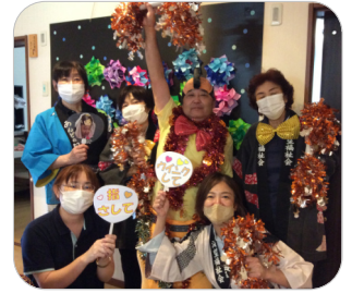
マツケンに変身した職員が登場すると、ご利用者の皆様から「きゃー!」「あはは!」と大きな笑い声が起こりました。