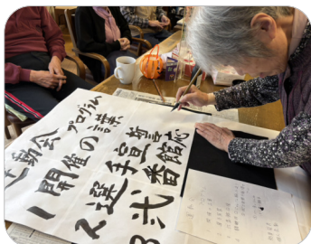
美しい文字でプログラムを書かれるご利用者様。

10月29日、運動会を開催し、ご利用者の皆様に3つの競技に挑戦していただきました。 花みずき式番館の運動会に初めて参加された方は「運動会なんて久しぶり、楽しいね!」と、にぎやかなひとときを楽しんでいらっしゃいました。