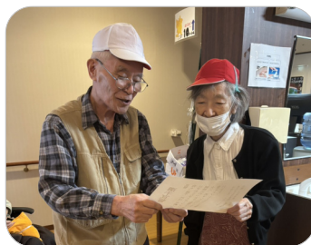
ご利用者様代表のお二人による選手宣誓。